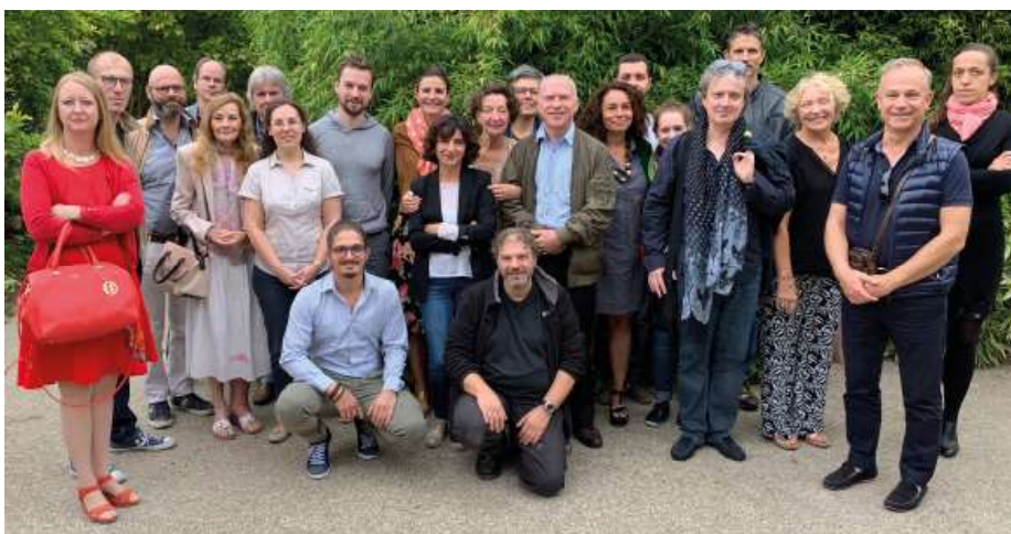
Rentrée des professeurs du conservatoire, le 13 septembre 2019. Retrouvez les sur www.conservatoire-bois-colombes.fr